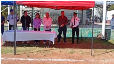
Premiación de la Liga a infantil de la Cancha Balcones 1.