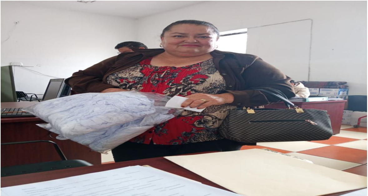
La Doctora del SMDIF atendiendo a las personas vulnerables en nuestro Municipio