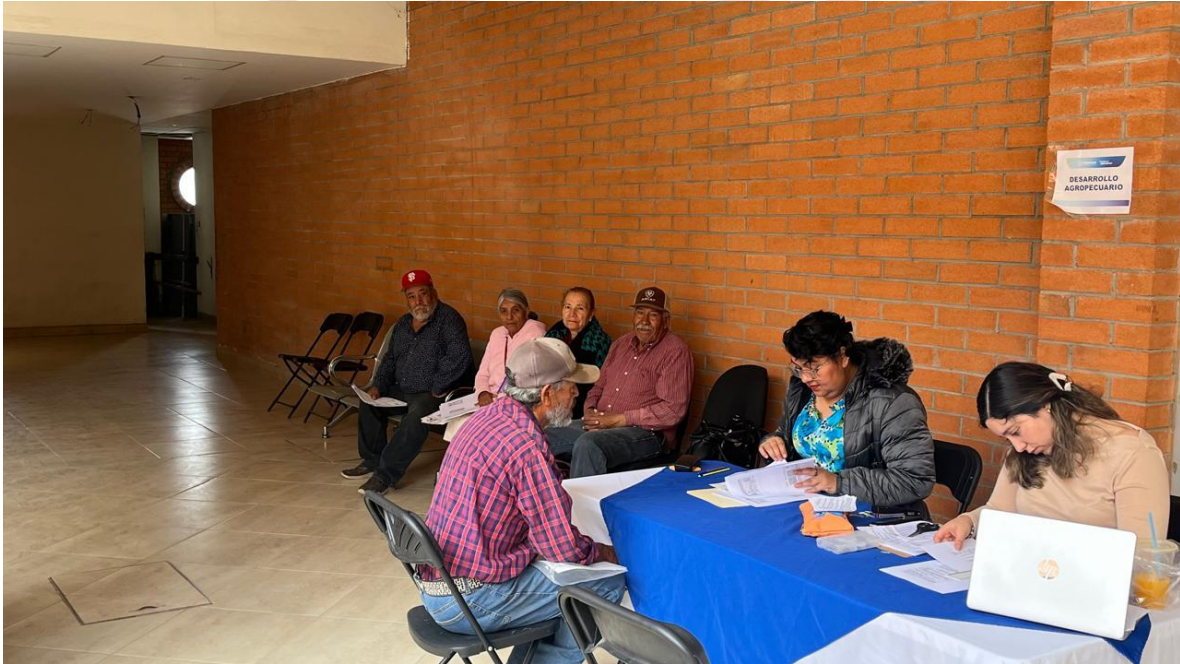
DIA 31 Cierre de convocatoria