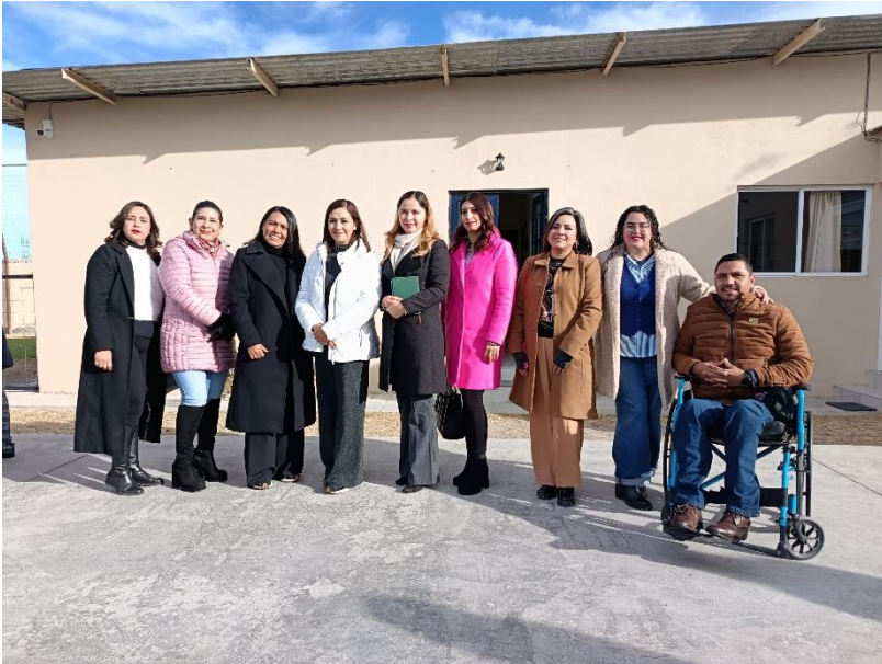
26 de enero de 2026 instituto CALE, colonia Miguel Hidalgo.

Se recibe el donativo de la ciudadanía con carácter anónimo de andador, andador con asiento y silla de ruedas #16