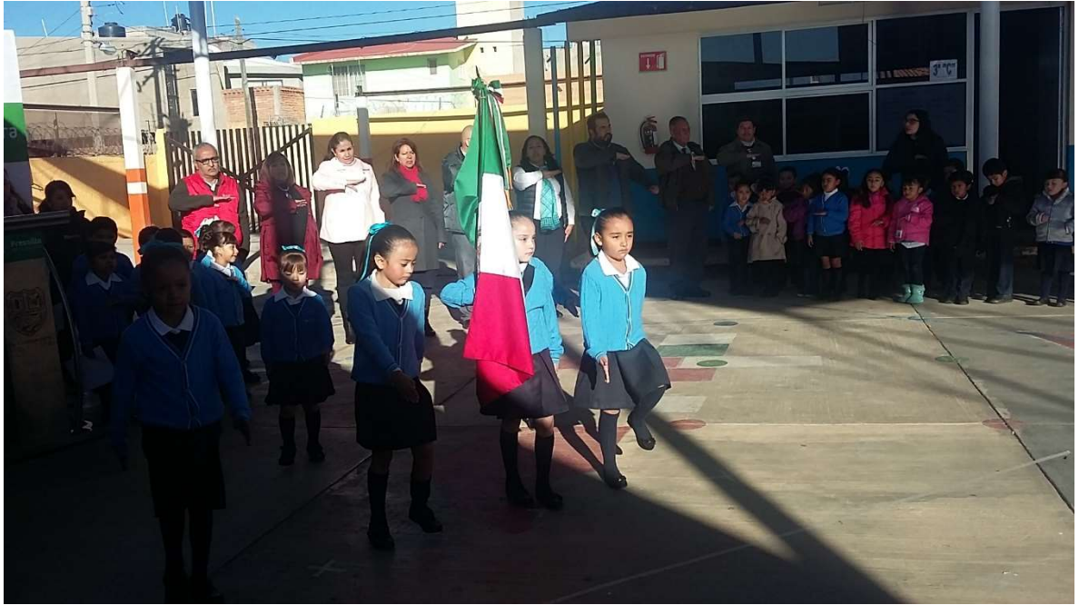
ESCUELA PRIMARIA FORD 126