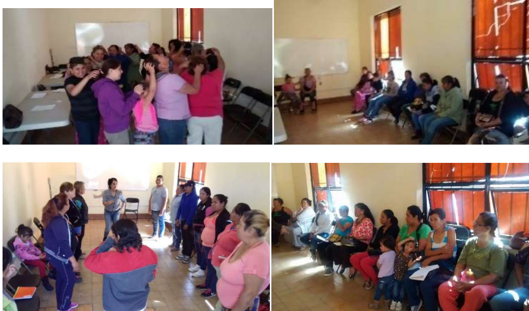
Escuela para Padres