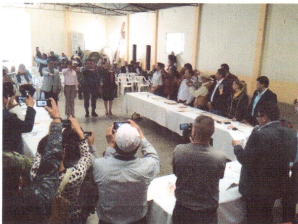
El 23 de mayo concurri a la celebracion de la sesion ordinaria de cabildo