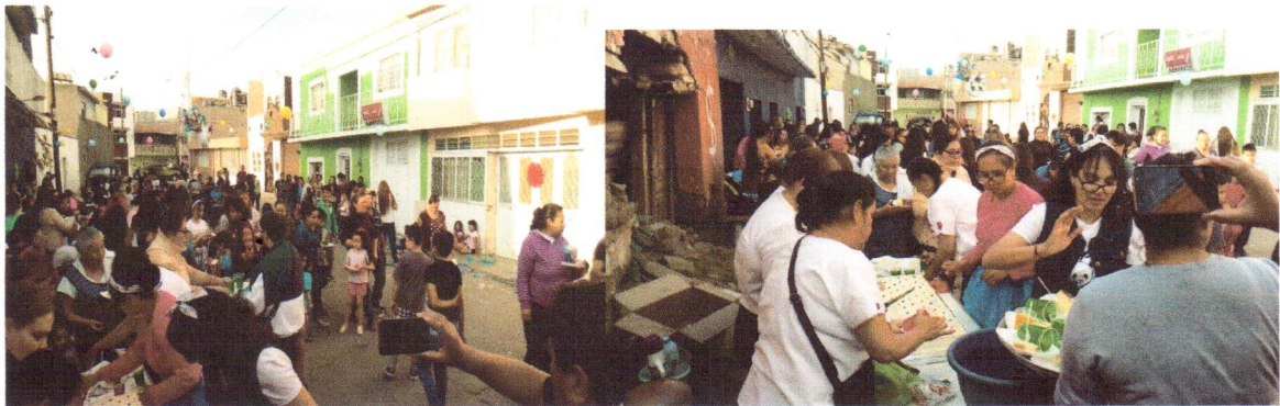
Atencion y gestion del mes de abril