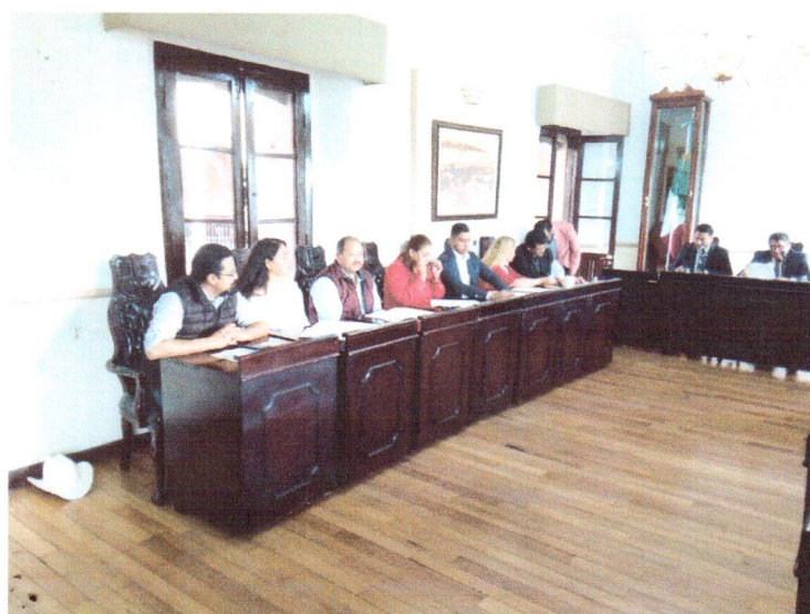
El 29 de Mayo igualmente asisti a la segunda sesion itinerante de cabildo