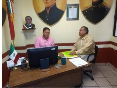
Supervisión de Izamientos de Bandera Nacional

Reunión con el titular de turismo para coordinar el desfile de aniversario