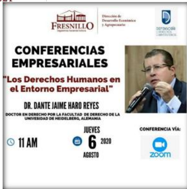
Conferencia Empresarial "Los Derechos Humanos en el Entorno Empresarial"