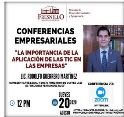
Conferencia Empresarial "La importancia de la aplicación de las Tic en las Empresas"